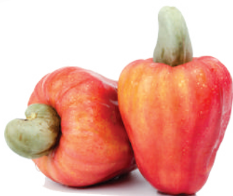
TẮC MẠCH MÁU BÚI TRĨ