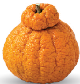
SA NGHỆT BÚI TRĨ